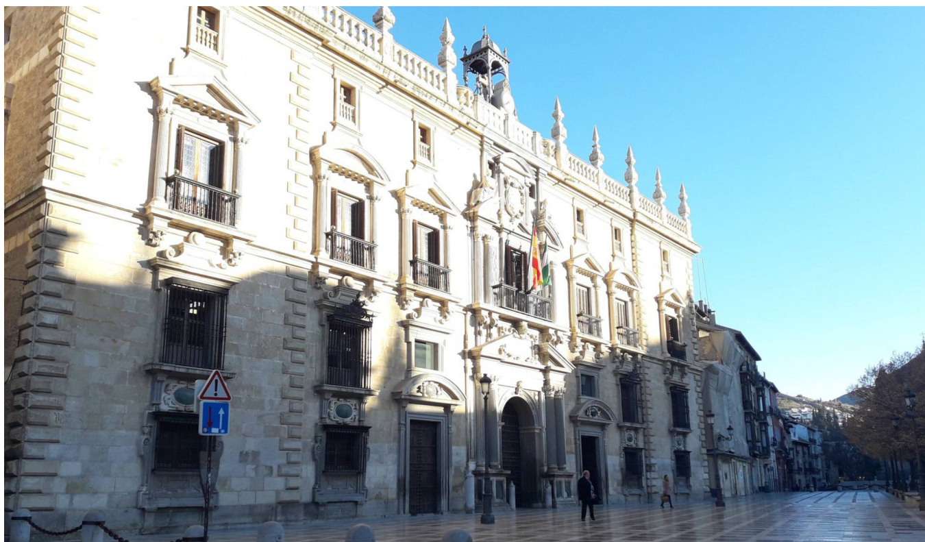
Real Chancillería de Granada, Sede del TSJA.