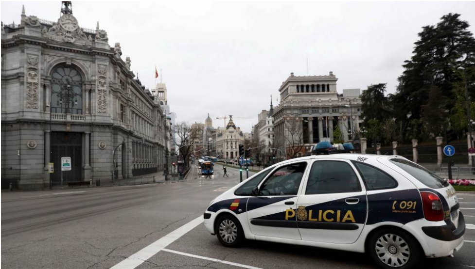
Sede del Banco de España.

La asociación de consumidores pide que se cree una autoridad independiente para desbloquear los juzgados de la avalancha de causas por el IRPH y las tarjetas 'revolving'