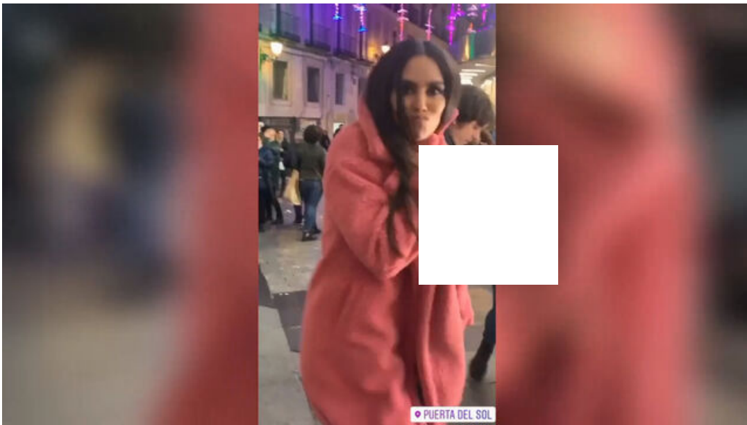
Cristina Pedroche, en ropa interior en mitad de la Puerta de Sol