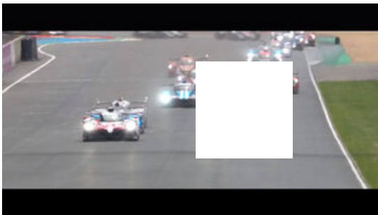
Trailer de las 24 Horas de Le Mans 2019