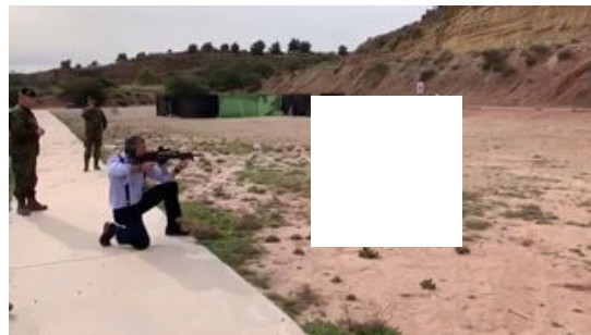
Javier Ortega Smith dispara un rifle de asalto...